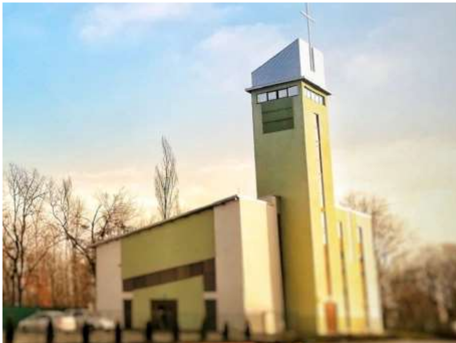
. Maranata Baptist Church Timisoara